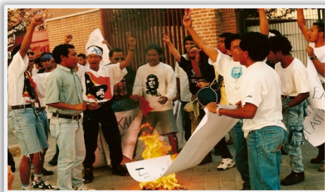
Demonstrasaun Pasífika iha Madrid, España