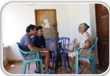
Peskizador Rekolla informaun liuhusi entrevista