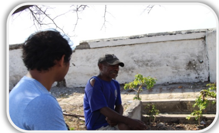
Istória Orál envolve dada lia informál no amizade

nakonu ho konfiansa antes realiza entrevista história orál. Peskizador-sira mos presiza esplika ba informante-sira, etika peskiza ne'ebé sira tenki asina no tanbasá. Informante-sira mos presiza hatene, informasaun hirak ne'e sei uza ba saida, bainhira no sé iha informasaun ruma ne'ebé sira sei la admite atu hato'o ba públiku ka uza ba objetivu entrevista nian. Ida ne'e importante, tanba povu, informante mak nain ba história orál.