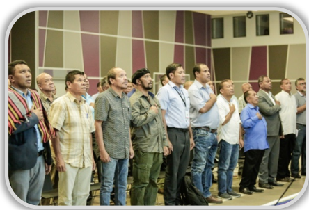
Partisipante Workshop I hananu Hino Nasionál, iha salaun Ministériu Finanzas

Dokumentu Traballu ida ne'e hatoo rezultadu husi apresentasaun no dikusaun ne'ebé halo durante workshop I no II ne'ebé realiza iha loron 10 Janeiro 2018 no 10 Maiu 2018. Workshop sira ne'e nia objetivu mak halibur hanoin husi públiku, hanesan; akademista, pratikante, peskizador, ofisiais no figura públiku, veteranu, líder juventude, no estudante-sira relaciona ho peskiza no hakerek livru knar juventude ho estudante sira iha história luta ba Libertasaun Nasionál. Alende simu subsidiu hanoin husi entidade no individu oioin, workshop ne'e mos mai ho objetivu atu introdúz no habelar ezisténsia Comité Orientador 25 ba públiku.