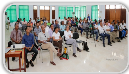
Partisipante Workshop II iha Salaun João Paulo II Comoro Dili Timor-Leste