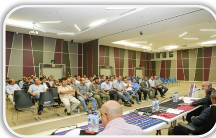
Parsipante no Orador sira iha Workshop I

sasin no autór história nian. Nune'e, programa ida ne'e iha espetativa oinsá atu halibur informasaun kona-ba história juventude iha inísiu movimentu ba libertasaun, no metodolojia peskiza istóriu no orál, inklui prátika peskiza história ne'ebé halo ona iha Timor-Leste.