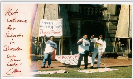
Demonstrasaun Pasífika iha Alemaña