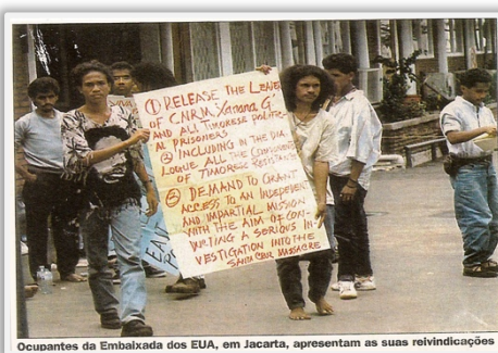
Ocupantes da Embaixada dos EUA, em Jacarta, apresentam as suas reivindicações

Sorin seluk, RENETIL mos halo nia operasaun ne'ebé la iha didin-lolon ida hodi satan netik nia bok-an, katak maske harii iha Bali, loke sela iha Timor no Indonézia laran maibé RENETIL mos iha nia