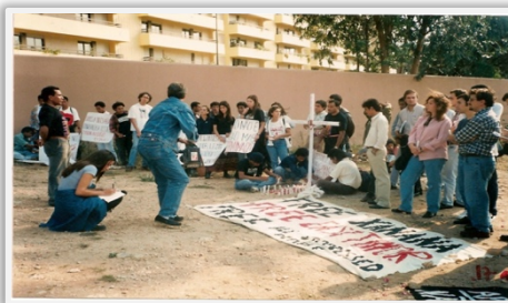
Demonstrasaun Pasifika iha Portugal